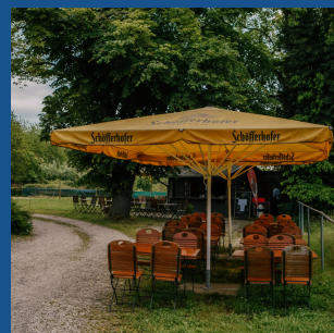
DAMPFERGARTEN bis zu 200 Personen