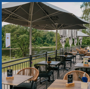
SONNENTERRASSE bis zu 150 Personen