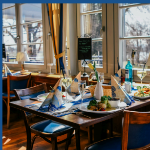
PROMENADEDECK bis zu 100 Personen

Melden Sie sich gerne jederzeit bei uns auf info@pillnitzer-elbblick.de oder unter + 49 (0) 351 42 483 33